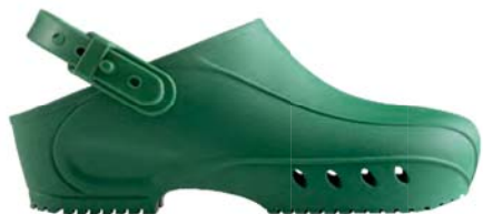
VERDE / GREEN VR 010