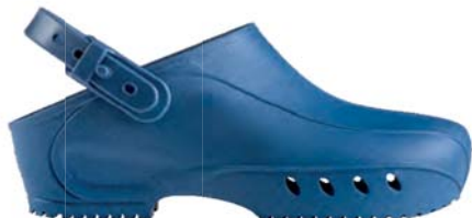
BLU / BLUE BL 020