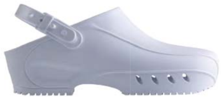
BIANCO / WHITE BN 010