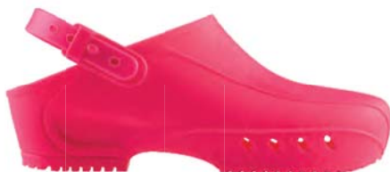
FUCSIA / PINK RS 033

Ordine minimo 10 paia per taglia / Minimum order 10 pairs per size.